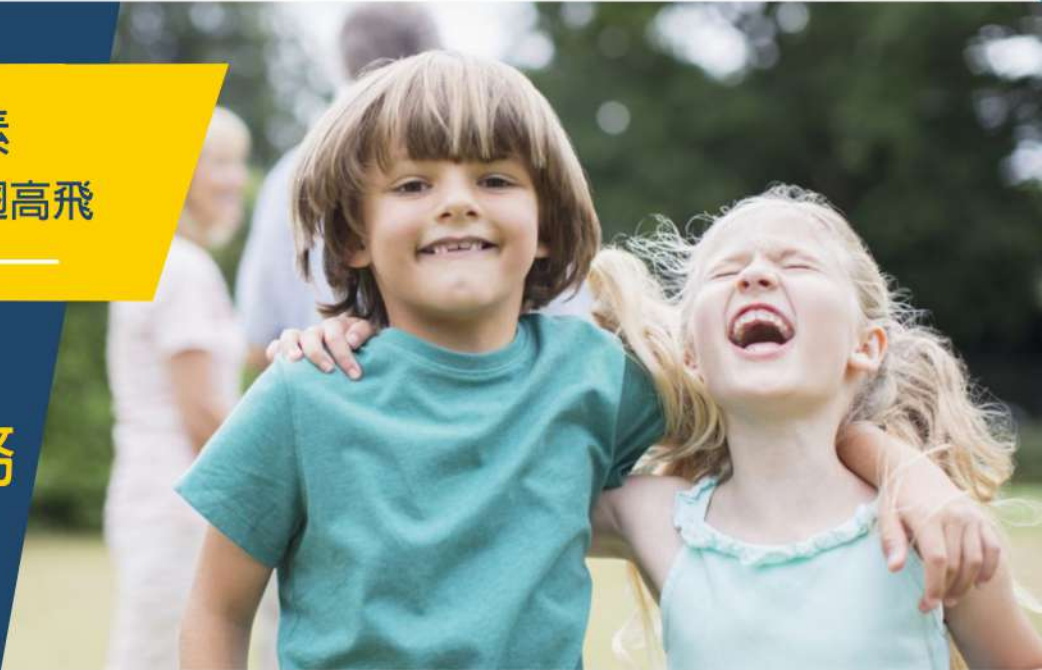
圖象設計非作任何參考之用

鑄博教育心理諮詢團隊從心理功能和健康層面提供系統引導和幫助，針對孩子心理質素的綜合評估結果進行多維度分析，幫助家長深入且全面地了解孩子的心理質素，並針對適合孩子的教養方式及態度提出具體的建議，提供跟進解決方案，從而促進家長與孩子良性互動，實現均衡心智發展。